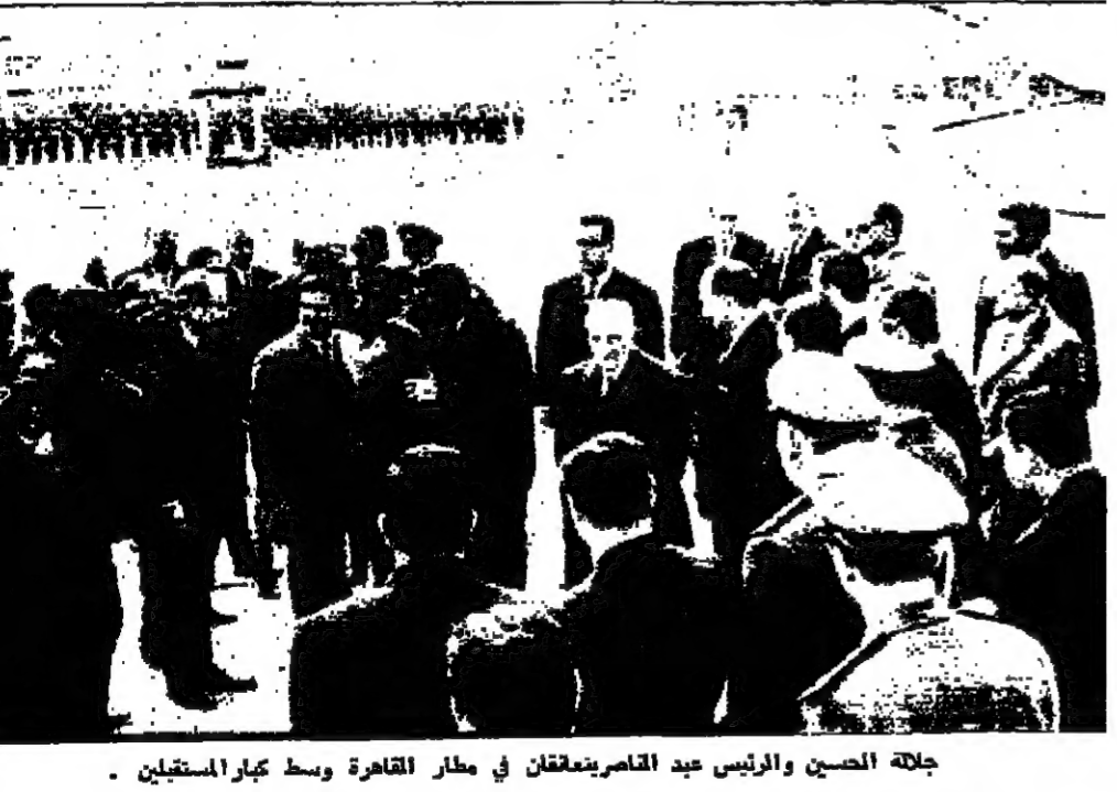
جلالة الحسين والرئيس عبد الناصر يتفقان في مطار القاهرة وسط كبار المسئولين

عمان - عاد حضرة صاحب الجلالة الملك الحسين المعظم الى عمان بعد ظهر امس بمسقط رأسه للقاهرة التي استقبلته يومين حيث التقى بسيدادته اخيه الرئيس جمال عبدالناصر مرافقو الملك